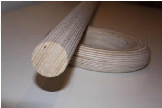
Sonderanfertigung ab Stückzahl 1